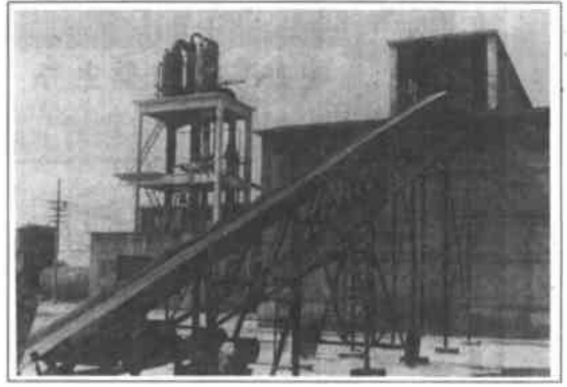
国家加碘盐定点厂——广饶县明华盐业有限责任公司洗精盐厂外景。

一月一调度，一月一检查，重大问题及时召开现场会研究拍板。目前，以发展盐业及盐化工为主的海洋化工有限责任公司已筹建完毕；渔民新村已完成考察定址工作；以发挥区内唐头营等人文景观优势的度假村也与油田有关单位达成了建设协议；对水产养殖制订了规划，并对闲置垂钓池、鱼池进行了修复，还在部分水面进行了鲈鱼等品种的试养工作。区内已形成原盐32万吨，碘精盐5万吨、溴素500吨、氯化钾3500吨及氢溴酸、钾镁系列产品500吨的生产能力。明华盐业有限责任公司还被评为国家定点碘盐生产企业，生产的“明华牌”营养盐分别荣获山东省一轻厅优良产品、首届中国金榜技术与产品博览会金奖，1994年荣获轻工部科技进步三等奖。 “一三五六”工程的实施，使清河办事处区域出现了多业并举的喜人景象。