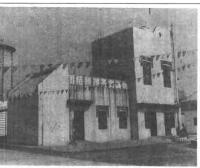
年产溴素500吨、氢溴酸300吨的广饶县盐化厂外景。

广饶县明华盐业有限责任公司是一家集原盐生产、精盐加工、经营于一体的山东省六家精盐加工工业企业之一。所生产的“明华牌”系列精盐产品畅销四个地、市、十七个县区，到9月底，仅精盐一项就实现产值758万元，完成销售收入564.5万元。 为实施名牌战略，他们把产品质量作为最根本的问题来对待，提出了“质量是名牌之母”的口号，坚持高起点、高档次、高标准和高技术含量。为此，近年来该公司培训、录用了一批科技管理人才，新上了再制盐项目，采用先进技术，通过与科研单位“联姻”等形式，加快新产品研制步伐，开发出了全价营养盐、富硒营养盐等系列产品，质量又比原来上了一个档次。 他们认识到，谁注重服务质量，时刻把消费者利益记在心中，谁就能赢得人心，创名牌就会成功。多年来，明华公司始终不忘用户就是企业的上帝，除加强质量检测，杜绝不合格产品流入市场外，还经常深入销区征求消费者意见，尤其是对碘缺乏病区，配合有关部门实行特供，受到了病区群众的好评。