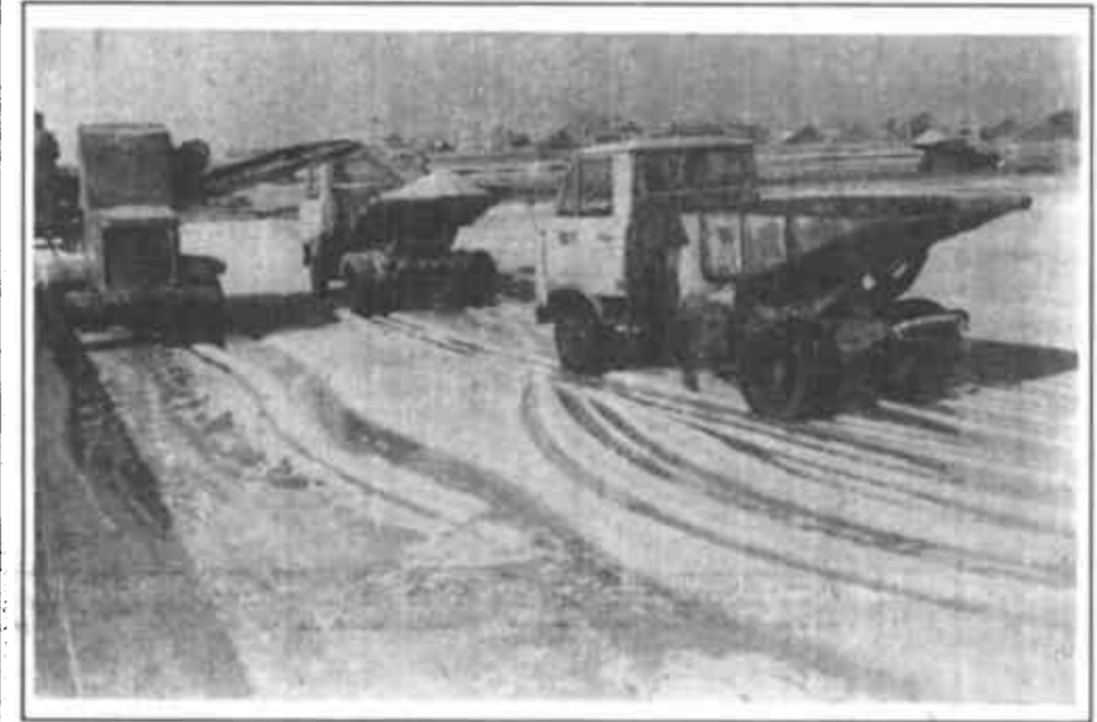
辖区内海河联运，年吞吐量200万吨的广饶北港为盐业及盐化工等产品销往各地提供了便利条件。