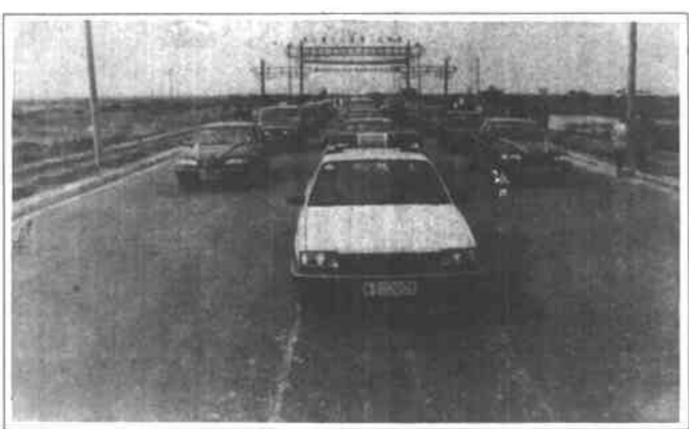
辖区内公路四通八达，交通便利。

广饶县盐化工业集团公司在盐业企业不景气的情况下，狠抓科技进步工作，加快实施人才战略，通过“科技兴盐”，使企业走上了健康发展的轨道。 这个公司领导认识到，科学技术是第一生产力，企业要发展，必须有一支高素质的科技人才队伍。该公司采取了一系列爱才、育才、重才的措施，首先是对到了退休年龄的老技术人员、老经营管理人员实行返聘，让他们继续搞研究、当参谋、做指导。公司还特别重视吸收培养年轻的技术人才，每年都不惜重金到大专院校招聘各类人才。同时还与山东轻工业学院、省盐校等大专院校、技工学校实行校校挂钩，定向培训人才。该公司还采取办学习班讲课等形式，使所有职工都经过了本专业的多次培训。目前，该公司具有专业技术职称的人员已占公司职工总数的15%，成为“科技兴盐”的骨干力量。